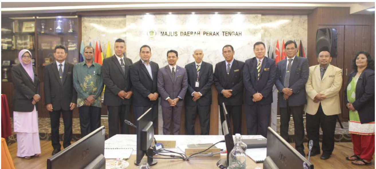
Antara barisan Ahli Majlis, Majlis Daerah Perak Tengah tahun 2020/2021