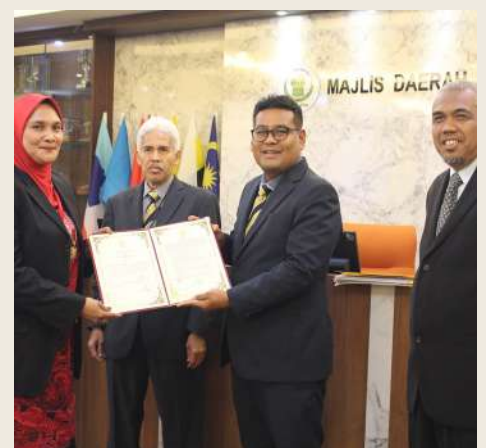
Majlis angkat Sumpah Penerimaan Jawatan Ahli Majlis, Majlis Daerah Perak Tengah tahun 2020/2021